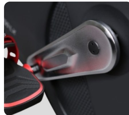
ТРЕХКОМПОНЕНТНЫЙ ПЕДАЛЬНЫЙ УЗЕЛ