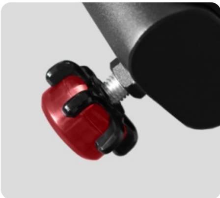
КОМПЕНСАТОРЫ НЕРОВНОСТЕЙ ПОЛА