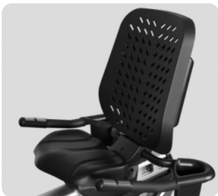
ЭРГОНОМИЧНОЕ СЕТОЧНОЕ СИДЕНИЕ