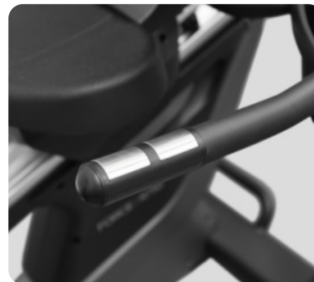
СЕНСОРНЫЕ ДАТЧИКИ ПУЛЬСА