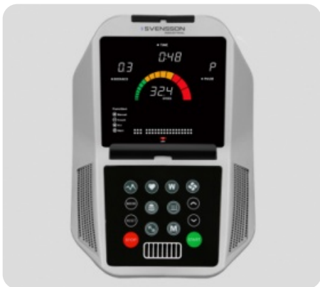
ДИСПЛЕЙ ПРОФЕССИОНАЛЬНОГО УРОВНЯ