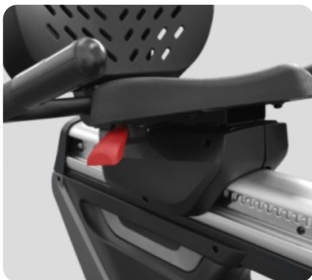
ГОРИЗОНТАЛЬНАЯ РЕГУЛИРОВКА СИДЕНИЯ