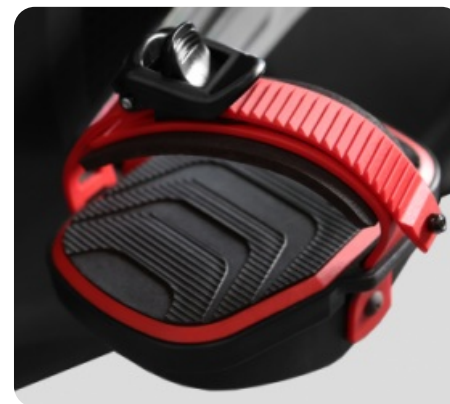
ПЕДАЛИ С КЛИПСОЙ