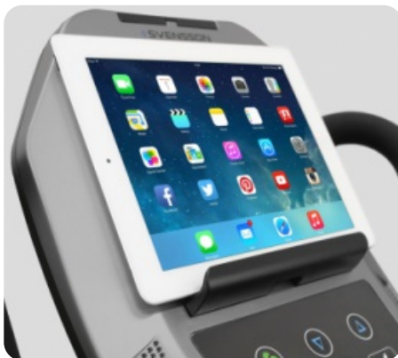
ПОДСТАВКА ПОД ПЛАНШЕТ ИЛИ СМАРТФОН